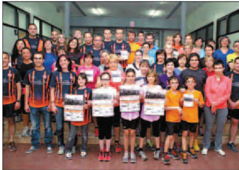
AJUNTAMENT DE TÀRREGA

Acto de presentación de la 13a Quart i Mitja Marató de Tàrrega