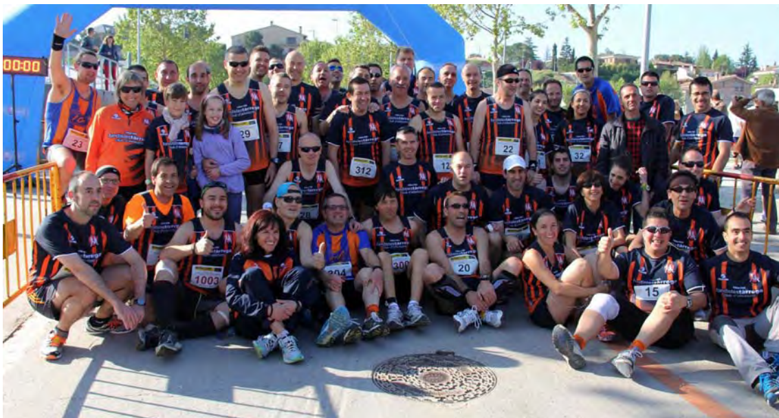
Membres del club participants a l'edició del 2013 del quart i Mitja Marató Ciutat de Tàrrega.