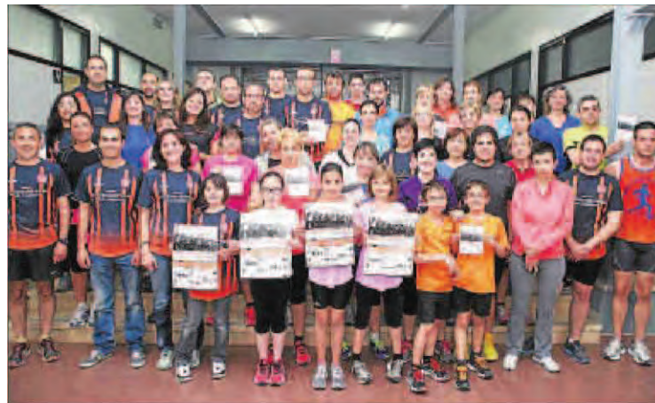
Presentaci3n de la principal cita atl3tica de la capital de l'Urgell