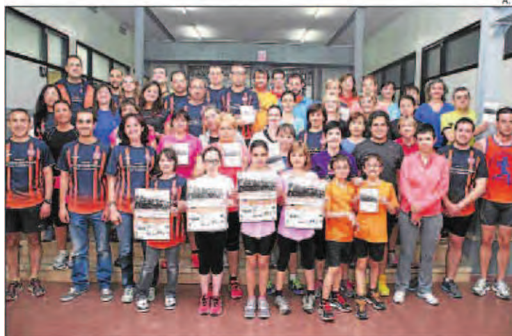
Els membres del Club d'Atletisme 100 x 100 Fondistes.

Les proves se celebraran diumenge al matí amb itineraris per l'Urgell i la Segarra