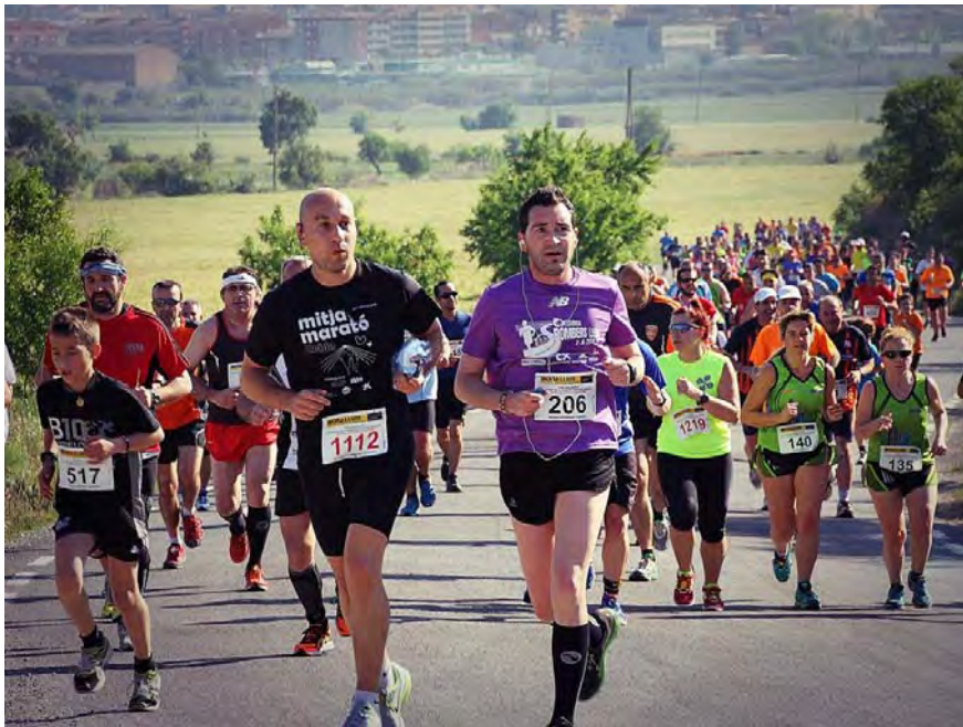
Imatge guanyadora de l'edició del 2013 (Fotografia: Mònica Campillo).

Els amants de la fotografia tenen l' oportunitat d'enviar a l'organització les imatges que hagin realitzat de la cursa. Un jurat escollirà la millor imatge de la cursa que serà premiada amb un sopar per dues persones al Restaurant La Cava de Tàrrega.